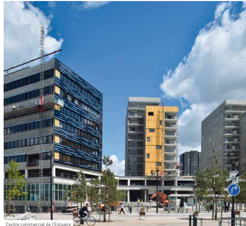
Centre commercial de l'Estuaire.

Le nouveau cœur de Malakoff/Pré-Gauchet a été conçu pour offrir à chacune et à chacun une qualité de vie dans un quartier intégré à la ville, avec une qualité des espaces publics et des logements, et des services facilement accessibles par toutes et tous. Ainsi, après l'ouverture du pont Éric-Tabarly, l'aménagement du boulevard de Berlin et la mise en route de la Maison des Haubans qui ont permis de renforcer l'ouverture du quartier sur le reste de la ville, tout un ensemble de commerces et d'activités vont s'organiser autour d'une place centrale. Elle fera le lien entre Malakoff et le secteur du Pré-Gauchet à vocation plus tertiaire mais qui accueille aussi de plus en plus de logements.