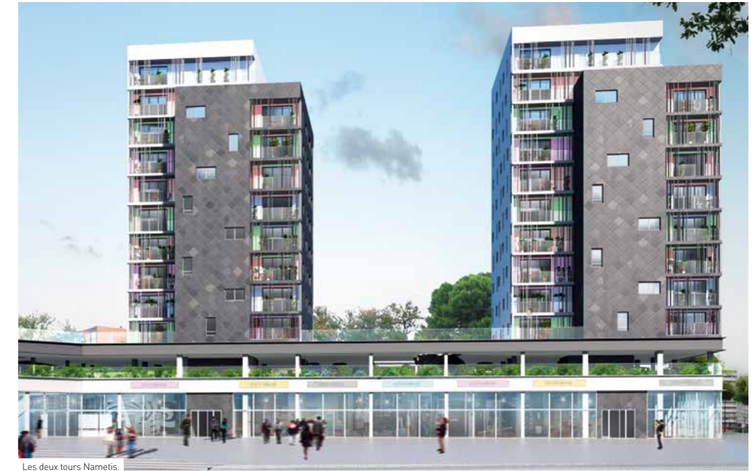
Les deux tours Namétis.