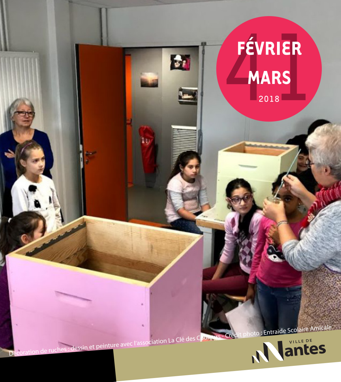
Décoration de ruches - dessin et peinture avec l'association La Clé des Couleurs